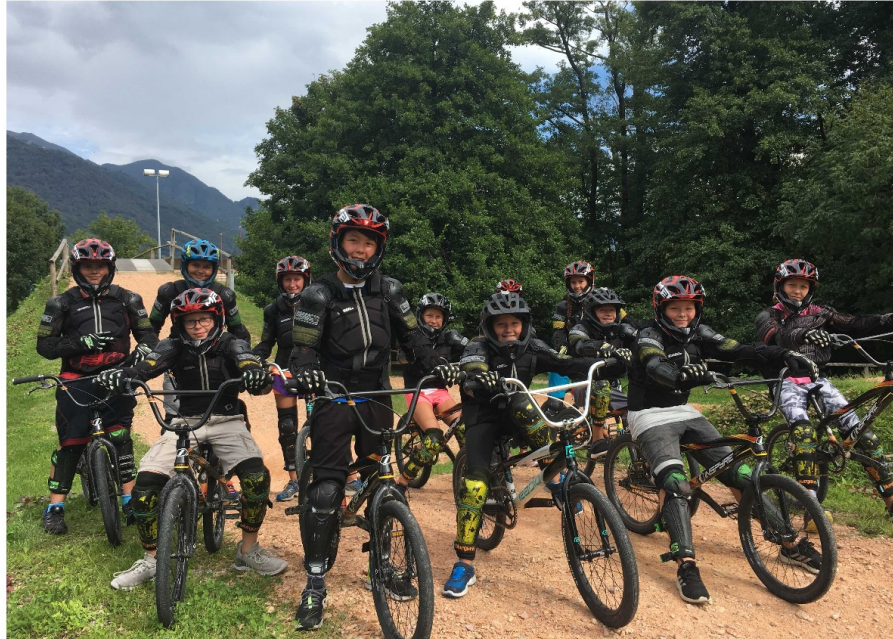
Caparaçonnés pour cette occasion unique!

Nous sommes allés pour la durée d'une semaine à un endroit appelé Tenero, cet endroit est situé au sud de la Suisse, juste à côté de l'Italie. A notre arrivée, de nombreuses activités étaient organisées pour nous: de l'escalade, du paddle, du kayak. Celle que j'ai adorée, c'était le BMX ! Nous avons commencé par une séance d'entraînement. Quand nous étions fin prêts, nous avons pu participer à des courses sur le circuit. C'était tellement amusant!