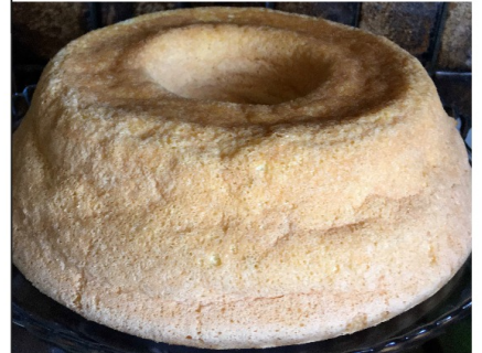
Pâtisserie du Portugal

Voici une spécialité portugaise: le Pao Lo. C'est un gâteau moelleux et délicieux qu'on fabrique pour les fêtes. La recette est simple: 200g de farine, 200g de sucre et 10 oeufs. Bon appétit!