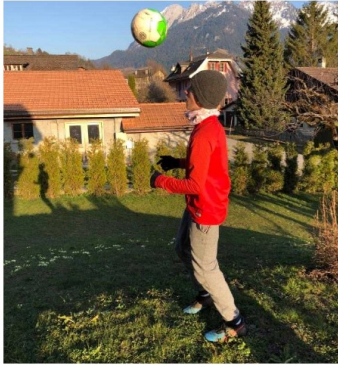
Petit entraînement matinal