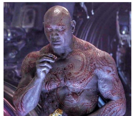
- citation de Drax, 2018 (Reddit)

dangereuse. Sinon nous vous conseillons un film moins violent, "Les Avengers, Infinity War". Ce film