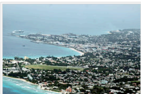
Rihanna a grandi dans la ville de Bridgetown , à la Barbade .