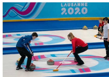
Tapera tapera pas ?

deux équipes de quatre joueurs sur une surface de glace rectangulaire? Son surnom de "roaring game" vient du grondement que fait la pierre de granit de 44 livres (19,96 kg) en se déplaçant sur la glace. Les règles du jeu: le match se déroule par équipes de 4. L'objectif est simple: lancer la pierre en direction de la cible. Pour la diriger, vous devez la faire glisser en frottant la glace avec un balai jusqu'à la faire se rapprocher du centre. Le concept ressemble beaucoup à la pétanque avec comme objectif d'avoir le plus de pierres dans la maison et de pousser celles des adversaires en dehors de celle-ci.