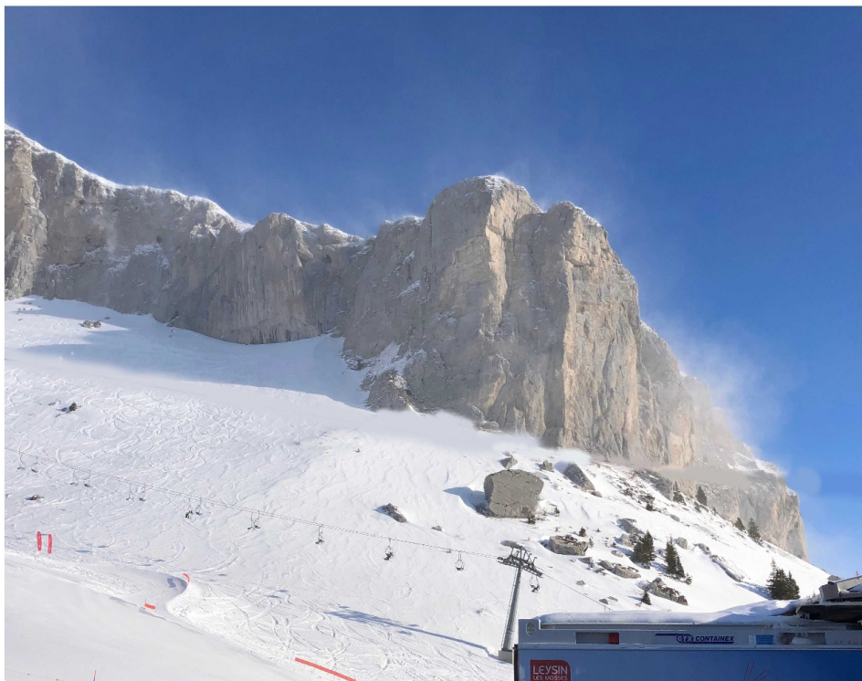
Le vent sur la tour d'Ai

L'annulation de la compétition pouvait être anticipée le matin même par la décision d'une première mesure : la fermeture du télécabine. La raison : l'annonce d'une journée venteuse. L'épreuve initialement prévue vers 9 heures a d'abord été reportée à 11 heures, puis finalement a été reportée