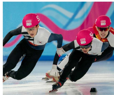
En constant équilibre...

Le short track est un sport qui se déroule sur une patinoire. Les concurrents s'élancent sur une surface standard de 60 mètres de long sur 30 mètres de large. Ils peuvent atteindre les 60km/h et peuvent s'incliner jusqu'à 60 degrés quand ils tournent dans les virages. La compétition se déroule sur 500m (4.5 tours de patinoire), 1000m (9 tours) et 1500m (13.5 tours). Quatre athlètes par course se trouvent sur la glace. Pour l'équipement, les athlètes ont une combinaison, une paire de patins dont la lame fait 35 et 50 centimètres... Pour se protéger des blessures, les "short trackers" peuvent