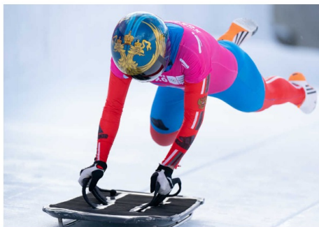
A nous la descente !

Le skeleton est un sport de glisse conçu dans les années 1880 à Saint-Moritz en Suisse. Le but est de descendre un couloir de glace de 1200 mètres le plus rapidement possible. La vitesse atteinte varie entre 120 et 140 km/m. Ce sport se pratique seul sur une planche de 80 à 120 centimètres. Le skeleton tient son nom de cette fameuse planche qui ressemble à un squelette.