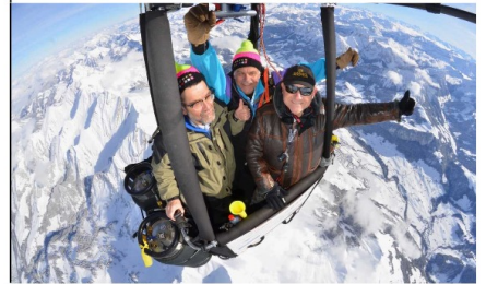
Photo prise lors du dernier vol mardi 29 au dessus de Châteaux-d'Oex. Le soleil et l'ambiance au rendez-vous.