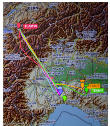
Carte du parcours des ballons lors de la course David Niven.

Il s'est dit que cette profession pouvait être intéressante. C'est un métier qui demande de la précision et un sens aigu de l'observation. Et surtout de la passion!